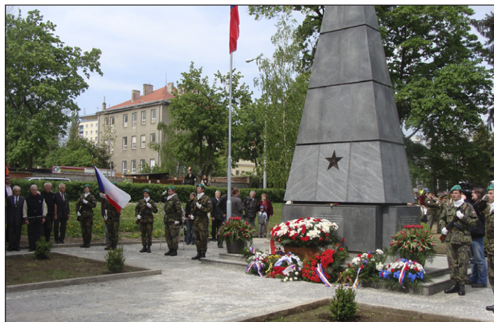
Pietní akt u opraveného památníku rudoarmějců v Králově Poli.

s novináři tu bude přítomno několik set osob. Neformálnost jednání spočívá v tom, že nebudou schváleny žádné konkrétní legislativní návrhy, půjde o to, aby se Evropská komise problematikou zemědělství zabývala. Naše delegace bude usilovat o systém jednoduché a pro všechny členské státy Evropské unie společné a od produkce oddělené plošné platby. Dosud právě na tuto otázku existují odlišné názory.