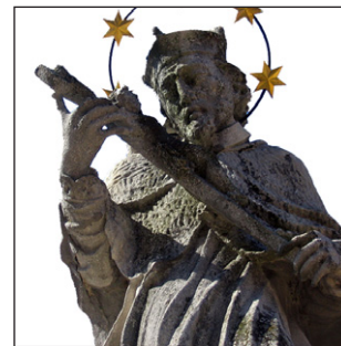
Sochami svatého Jana Nepomuckého je doslova poseta celá Česká republika.

Hájek se dopustil hlavního omylu tím, že vedle existujícího generálního vikáře Johánka z Pomuku, jehož životopis značně zkreslil, vymyslel jiného Jana, nazvaného Nepomuckým, který prý byl zpovědníkem královny a kterého král mučením nutil k vyzrazení zpovědního tajemství. Když se Václav nic nedověděl, dal tohoto Jana utopit. Tento výmysl zkoumal v 18. století piarista Gelasius Dobner a došel k závěru, že tzv. Jan Nepomucký, dle Hájka králem zavražděný roku 1383, neexistoval a zpovědníkem královny být nemohl, protože Václav byl v den jeho údajné smrti ještě svobodný a jeho druhá žena, královna Žofie Bavorská, měla za zpověd-