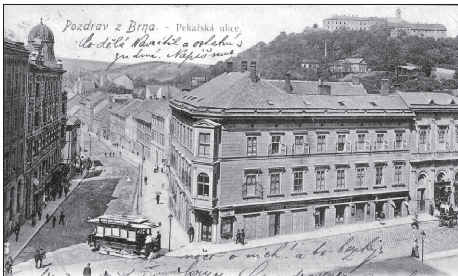
Pohled do Pekařské ulice.

Rozhodnutí Rady města Brna lze uvítat. Vždyť poslední dvoudílné Dějiny města Brna vyšly na počátku 70. let minulého století. Snahy zpracovat podobou publikaci existovaly, soupisu dějin