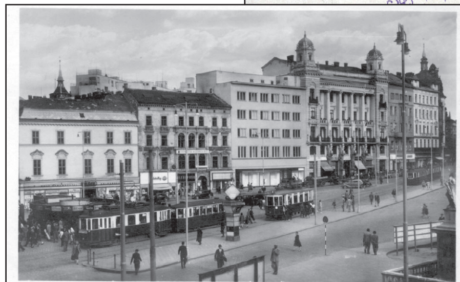
Pohled na náměstí Svobody.

lené v obecních volbách stejně jako místní výbory v městských čtvrtích Brna. Za nacistické okupace bylo městské zastupitelstvo zrušeno (stejně jako místní výbory) a v čele města byl starosta a úředníci z řad členů NSDAP.