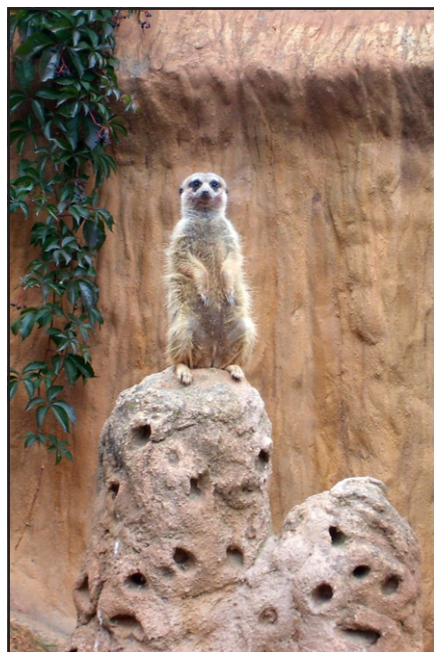
ZOO Brno (surikata)

ubikací. Postaví se i nový venkovní výběh s jezírkem a vodopádem. Směrem k návštěvníkům bude výběh vymezen zábranami z plných stěn a bezpečnostního prosklení, svrchu pak zakryt nerezovou sítí. V druhé etapě je plánována výstavba druhého venkovního výběhu. I ten bude simulovat co nejpřirozenější životní prostředí a zajišťovat plnohodnotný fyziologický a sociální život chovaných zvířat. Proto ani zde nebudou šimpanzům chybět kmeny, skály, úkryty, lanové houpačky, vzrostlé stromy, atd. Úpravy budou ukončeny v roce 2011. did