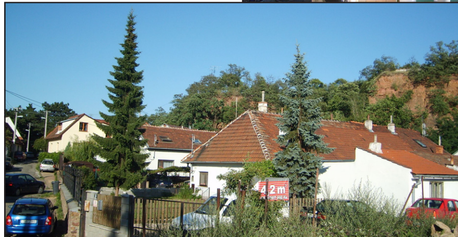
Kamenná kolonie dnes.