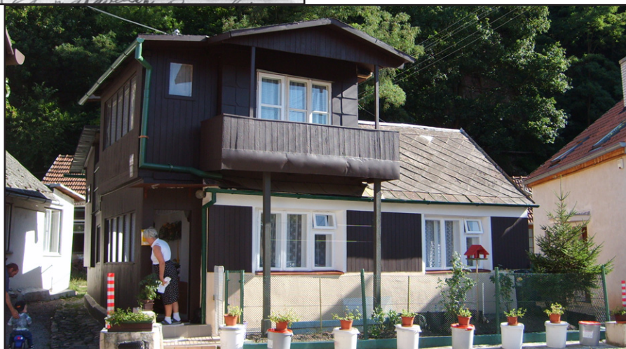
Kamenná kolonie dnes.

Druhý díl knihy věnuje autorka odpovědi na otázku Jak to bylo a je s názvy ulic v Brně od začátku. Patnáct stran knihy popisuje názvy ulic od 13. století do roku 1918. Další části knihy věnuje autorka změnám v pojmenování ulic v letech 1918-1939, 1939-1945 a 1945-