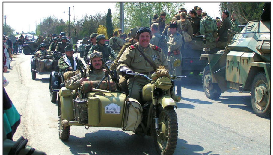
Rekonstrukce bitvy o Brno - Ořechov..

Pietní shromáždění občanů na Ústředním hřbitově se koná 27. dubna 2009 v 16,00 hodin.