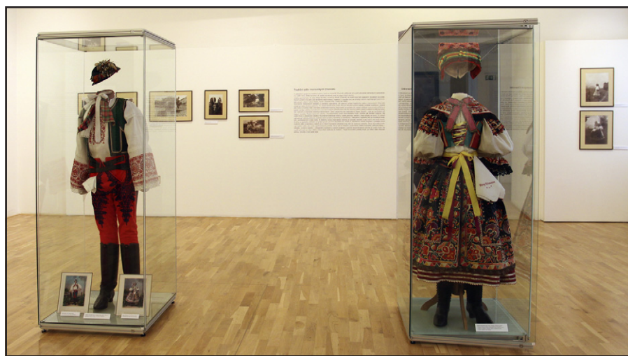
Výstava jihomoravští charvátů.