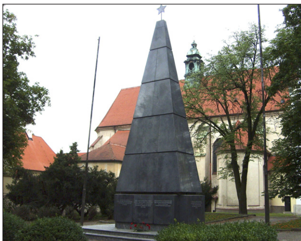
Pomník Rudé armády v Králově Poli.

Tibor DÁVID, tiskový mluvčí MěO KSČM v Brně