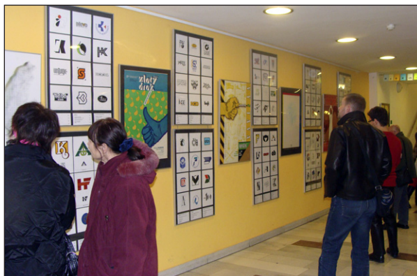
Výstava grafické tvorby Františka Borovce v HaDivadle se setkala s takovým úspěchem, že byla prodloužena do konce dubna. Fotografie přibližuje atmosféru mimořádně hojně navštívené a úspěšné vernisáže.