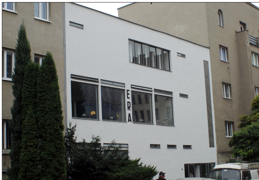
Kavárna Era.

původního majitele. Restituent tvrdil, že kavárnu opraví a zprovozní. Objekt se menších úprav dočkal, ale byly necitlivé a ke škodě památky. Nakonec restituent zchátralý a zvlhlý objekt prodal Luboši Ptáčkovi a ten se dohodl s občanským sdružením Studio 19 na dlouhodobém pronájmu. To s využitím dotace z Evropské unie, z Regionálního operačního programu ROP - Jihovýchod, objekt opravilo do původního stavu, takže v něm mohl být konečně po desetiletích obnoven kavárenský provoz. Ve druhém poschodí Ery bude zřízena expozice, věnovaná brněnskému funkcionalismu. (mil)