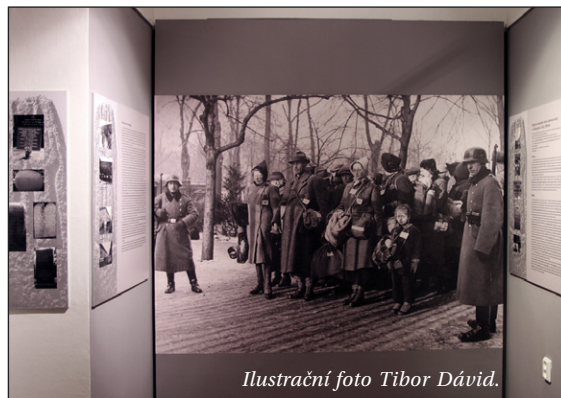
Ilustrační foto Tibor Dávid.

Po německé nacistické okupaci ČSR 15. března 1938 začalo postupné vylučování židovského obyvatelstva z veřejného života ve všech směrech. Pak nastalo „ konečné řešení židovské otázky “ jejich hromadným zabíjením ve vyhlazovacích