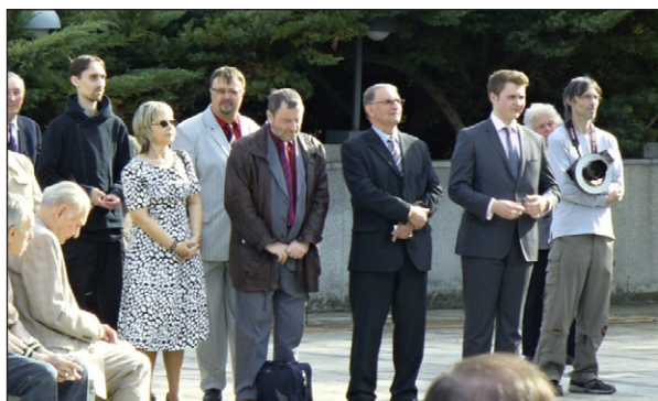
Projevy hostů na pietním shromáždění na čestném pohřebišti.

KSČM a já osobně uděláme všechno proto, abychom ctili oběti osvobozovacích bojů a aby tyto oběti nebyly zapomenuty. Nebudeme litovat sil ve snaze vrátit do této země a společnosti kulturu, etiku, morálku, právo, pravdu, solidaritu a úctu k sobě i k ostatním. Dlužíme to nejen vám, ale i naší budoucnosti. Čest vaší památce!