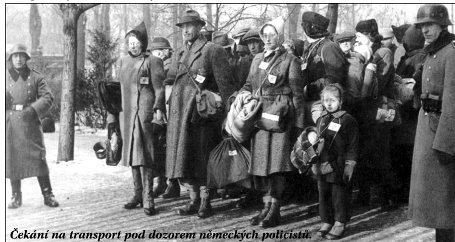
Čekání na transport pod dozorem německých policistů.

Mapa ghatt, koncentračních a vhlazovacích táborů v Evropě za 2. světové války předchází místům úmrtí Židů: Minsk, Riga, Izbica, Piaski, Rejowiec, Lublin, Varšava, Zamość, Sobibor-Ossowa, Trawniki, Malý Trostinec, Baranoviči, Raasika, Treblinka, Osvětim, Majdanek, Belžec, Chelmno. Některé transporty Židů z Terežína směřovaly na uvedená místa, zejména do Osvětimi, odkud již většinou nebylo návratu.