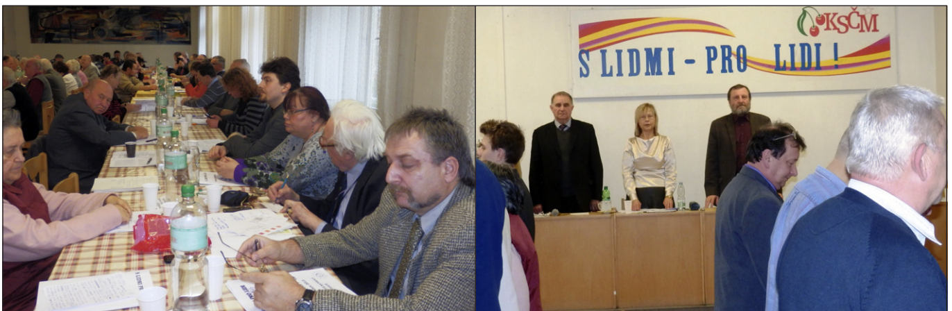
Z jednání městské konference KSČM v Brně.

Navrženou politickou linii rozpracujeme do termínových a obsahových plánů MíV, MO a ZO KSČM s důrazem na zachování funkčnosti členské základny a získávání co nejširší veřejné podpory pro politiku KSČM.