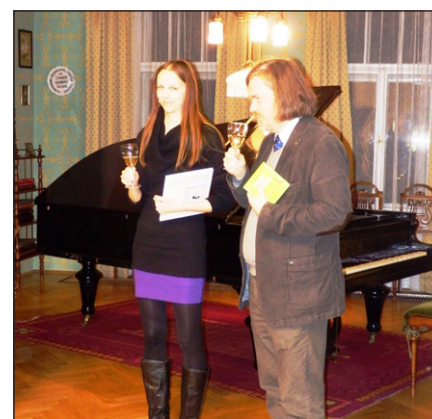
Autoři knih o Janáčkově.