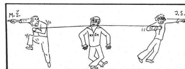
Hurá na sjezd!