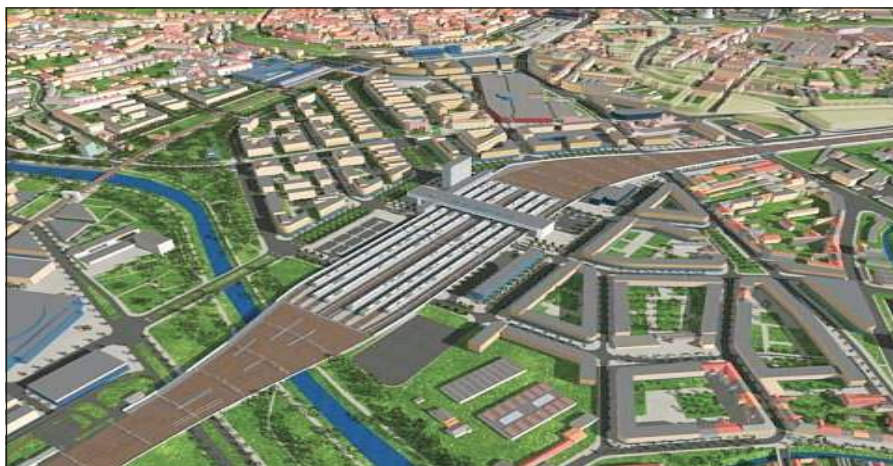
(Ilustrační foto archiv redakce)