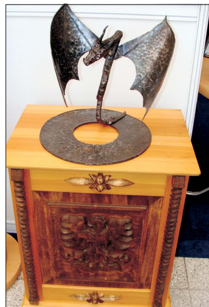
Ilustrační

Druhá část výstavy je věnována technickému smaltu. Historie technického smaltu je spojena s Moravou, Brnem, průmyslovou revolucí i emancipací českého národa. Začíná osobností starohraběte Huga Františka Salma z Blanska. V době Napoleonovy kontinentální blokády roku 1806 nemá Evropa čím sladit. Třtinový cukr se nesmí z nepřátelské Anglie dovážet a sladí se i zahuštěnou březovou mizou. Získat cukr z řepy je chemický problém. Salm s předstihem od roku 1798 v Berlíně studuje nejnovější poznatky výroby této perspektivní komodity z domácích surovin. Roku 1808 pracuje pod cizím jménem v Anglii jako dělník a provádí tam průmyslovou špionáž. V tehdy nepřátelské Anglii riskuje vězení a deportaci do