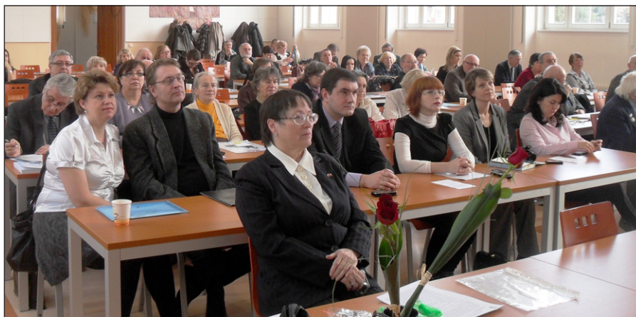
Konference Rusové a Morava.