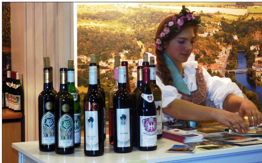
Foto jedné z expozic na veletrhu REGIONTOUR