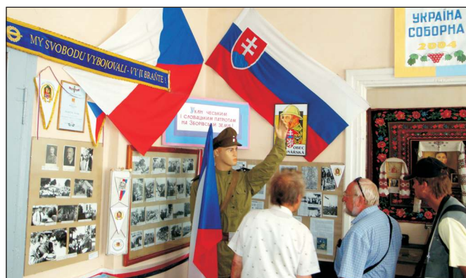
Muzeum ve Zborově.

Seriál v Lidových novinách o Velké říjnové ... připomněl v 5 rubrikách důležité události i osobnosti pochopitelně s dnešním anti-zaměřením. Vytratila se skutečnost, že bez VŘSR by nevznikl stát, mocnost, která se významně, ne-li nejvíc, zasloužila o vítězství ve Velké vlastenecké válce sovětského lidu a jeho Rudé armády, ve druhé světové válce vůbec.