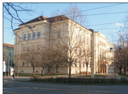
JAMU Brno