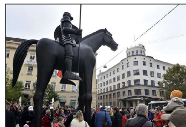
Brněnský rébus - kůň nebo žirafa?

Skromný člověk a dlouholetý funkcionář KSČ opustil svět 13. června 1973. kj