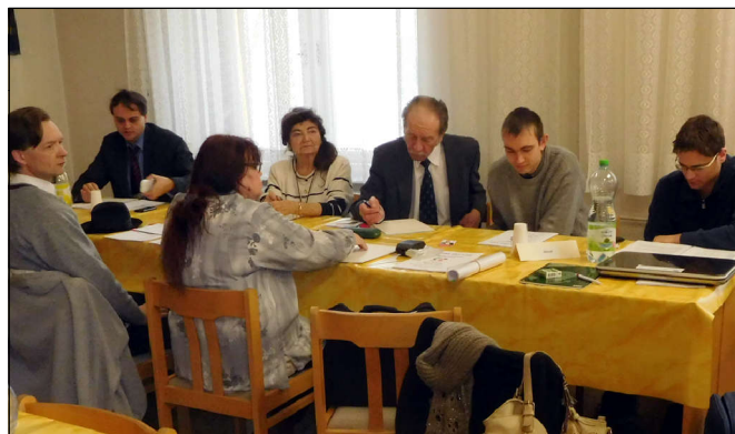
Účastníci konference na fotografiích Oldřicha Duchoně.