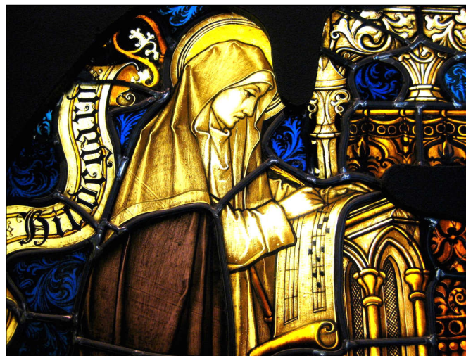
Svatá Hildegarda