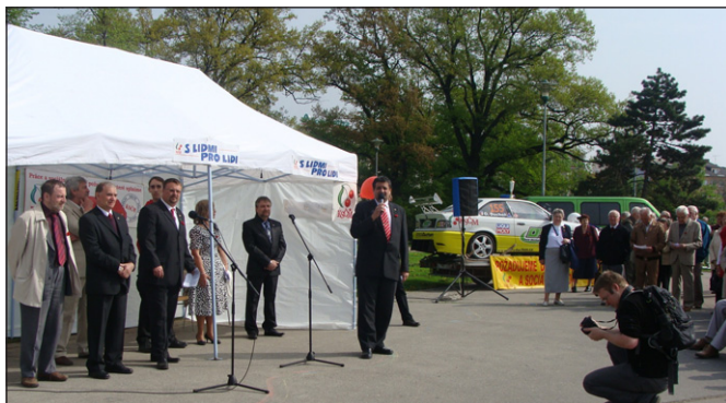
Prvomájové oslavy 2013 v Brně.