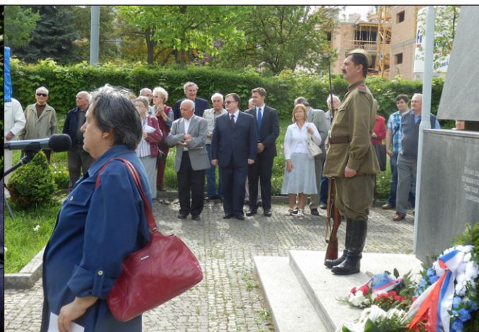
Krátká fotoreportáž Tibora Dávida dává nahlédnout na oslavy osvobození v Ořechově a Králově Poli.