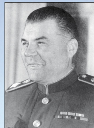
Maršál SSSR R. J. Malinovskij