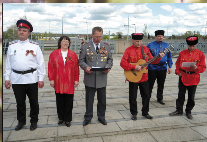
Pietní akt k 70. výročí osvobození Brna Rudou armádou 26. dubna 2015.