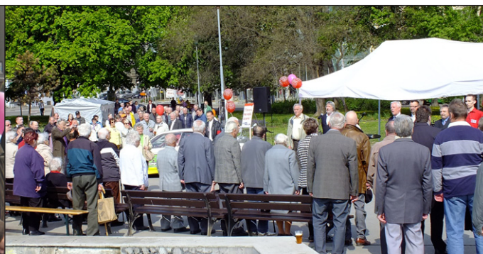
Prvomájový mítink na Moravském náměstí.