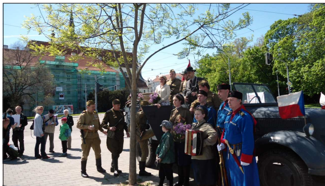
Za fotografie děkujeme autorům a pořadatelům jednotlivých akcí.

"V novodobých dějinách Brna zanechal neblahé stopy Německý dům, který chce brněnský magistrát připomínat i při letošním setkání s potomky sudetských Němců. Po válce zbouraný Německý dům je symbol nejhoršího útlatku českého národa v době před a za německé nacistické okupace Čech a Moravy. Nebudeme tolerovat omlouvání se odsunutým Němcům, kteří se nám za hrůzy války ani rádně neomluví. Naopak mají mít navždy pokoru před tím, co způsobili jejich otcové a dědové tomuto světu. Nebudeme tolerovat snahy vedení města Brna podporovat akce sudetských Němců. Sejdeme se 20. května 2017 ve 13 hodin u pomníku T. G. Masaryka na Komenského náměstí a pak v parku na Morav-