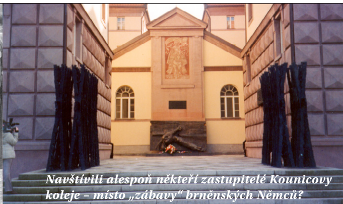
Navštívili alespoň někteří zastupitelé Kounicovy koleje – místo „zábavy“ brněnských Němců?