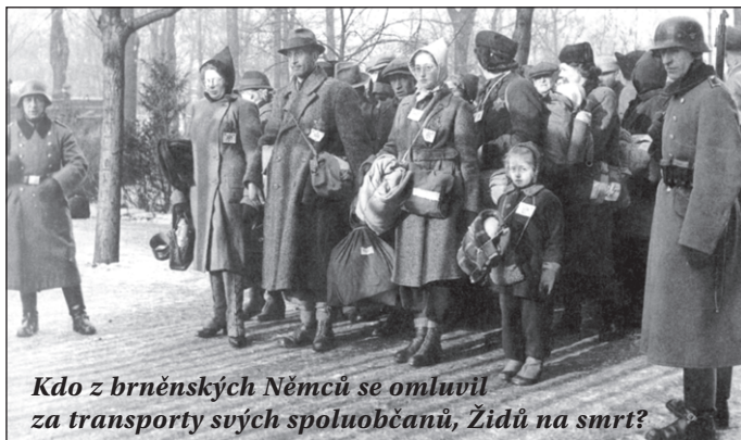
Kdo z brněnských Němců se omluvil za transporty svých spoluobčanů, Židů na smrt?

S tím se nelze smířit, jak to schválilo v Deklaraci pravicové vedení města Brna! (vž)