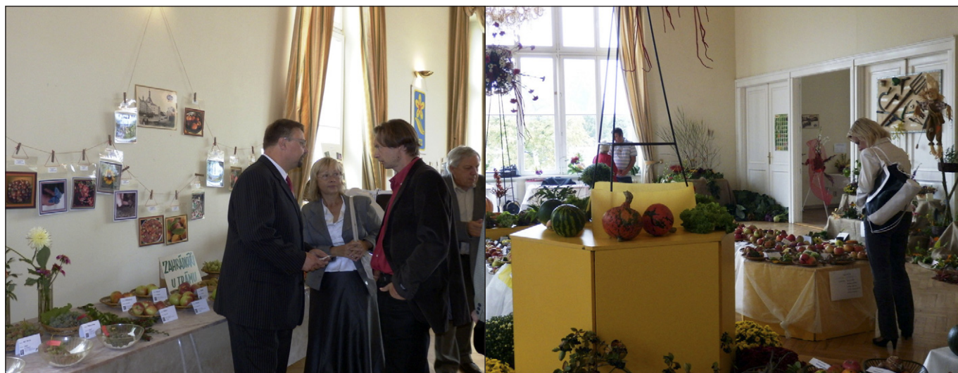
Fotografie z letošní úspěšné výstavy brněnských zahrádkářů.