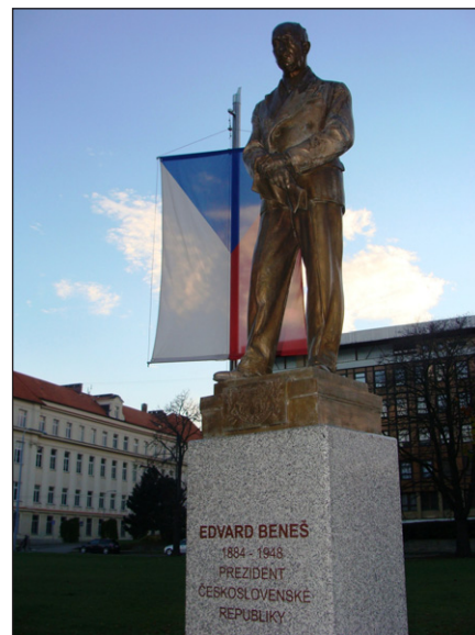
Pomník E. Beneše před PF MU.

ženo 1. dubna 1990 a usilovalo o samosprávné vedení Moravy a Slezska v rámci federace, o obnovu zemského zřízení a uznání Moravy jako národa s vlastní právní subjektivitou, posílení obecní a územní samosprávy. Ve volbách v červnu 1990 získalo HSD-SMS 9 mandátů ve Sněmovně lidu FS (6 %) a 7 mandátů ve