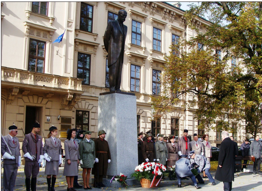
Letošní pietní akt u pomníku T. G. Masaryka.

V závěru stati V. Bělohradský uvádí, že Masarykovo dílo zůstává před branami 20. století a klíč k jejich odemknutí v něm nenajdeme. Existují prý 4 důvody, proč tomu tak je. Za prvé, Masaryk tušil, že válku nelze pochopit jen z cílů