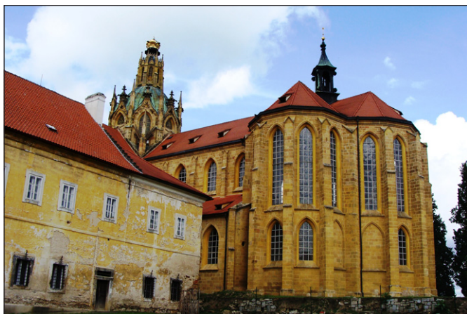
Klášter Kladruby u Stříbra.

Církev, které měly v minulosti nad lidmi obrovskou, často doslova neomezenou moc, nesou zodpovědnost za to, jaký byl svět, ve kterém působily. Nesou zodpovědnost za to, že vedle nádhery kostelů se krčily, a mnohde se i dnes krčí chatrče bosých a hladových. Církev římsko-katolická by měla přijmout také svoji spoluzodpovědnost, že ani tam, v těch státech, kde je její vliv ještě dnes velký, nedokázala odstranit nedůstojné životní podmínky lidí – tj. altruismus a pomoc bližnímu. Protože nedokázala odstranit ze světa bídu a chudobu, lidé ve své touze po lepším životním údělu, i v souvislosti s vývojem světa a vzdělanosti, se začali od ofici-