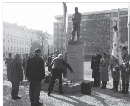
Pietní akt u sochy E. Beneše 28. 10. 2014.

Všem našim oslavencům děkují za práci pro stranu a socialistickou společnost ZO (MO) a MěV KSČM, LKŽ Dobromysl a k přání dlouhých let a dobré zdraví se připojuje také redakce ECHO.