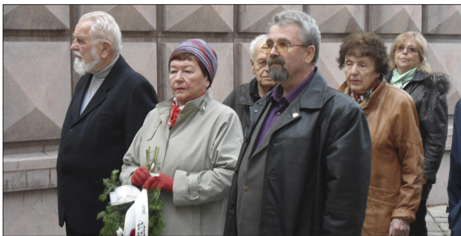
Kytičku k památníku položili i představitelé Společnosti Ludvíka Svobody.

Ministr školství Chládek v památníku protifašistického odboje v Kounicovských kolejích zdůraznil, jak je nutné říkat mladým, že nebyl jen 17. listopad 1989, ale také 17. listopad 1939, který byl důvodem proč se studenti před 25 lety šli a šli průvodem. Děti v základních a středních školách tuto historii už téměř neznají. „Chci, aby výklad dějepisu nekončil obvykle 1. světovou válkou. Měl