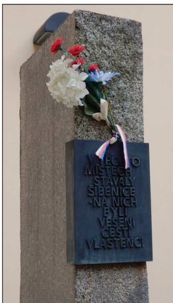
„Kounicovy koleje“